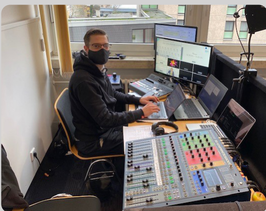
rentevent setzt den DHV in Szene