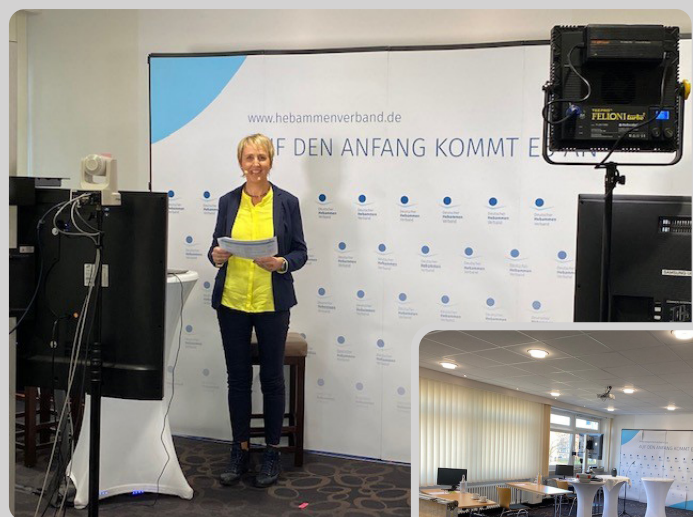
Die Moderatorin führt vor Ort durch die Tagung