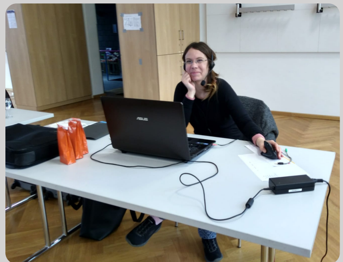
Entspannt im Backoffice - die Versammlung läuft