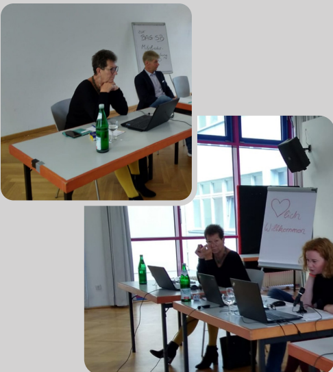
Volle Konzentration bei der Vorbereitung